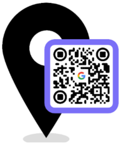
Сайт «Класи безпеки»: місце розташування класів безпеки

Перейти до бази класів безпеки можна за QR-кодом на зображенні нижче.