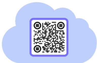
Електронна база класів безпеки у Хмельницькій області

Навчання в класах безпеки здійснюватиметься відповідно до типових освітніх програм, зокрема при реалізації наскрізних змістових ліній: екологічна безпека, громадянська відповідальність, здоров'я і безпека та викладанні предметів соціальної і здоров'язбережувальної галузі, у тому числі «Захист України», «Здоров'я, безпека та добробут» та інших.