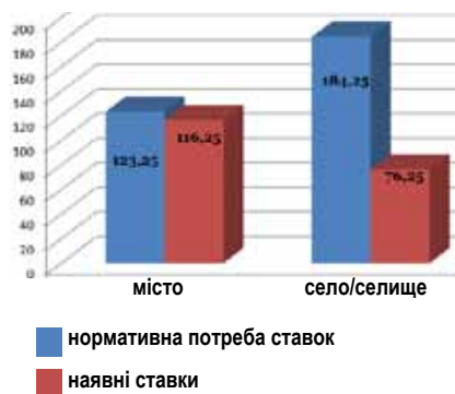
Забезпеченість закладів освіти соціальними педагогами

Особливо гострою в області є проблема забезпечення освітніх закладів соціальними педагогами, до професійних обов'язків яких, в першу чергу, входить робота з проблемними сім'ями, сім'ями, які потрапили в складні життєві