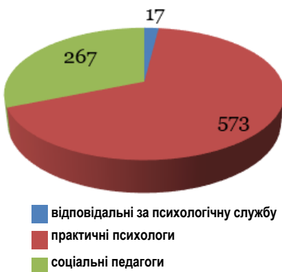
Забезпеченість закладів освіти фахівцями психологічної служби у 2022/2023 н.р.

Найкращі показники забезпечення закладів освіти посадами практичних психологів, соціальних педагогів у Нетішинській, Шепетівській міських територіальних громадах.